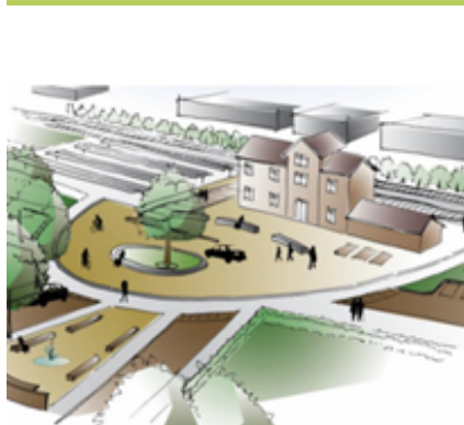
beeld inrichting stationsgebied.