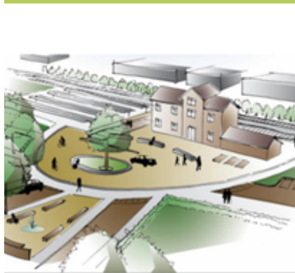
beeld inrichting stationsgebied.